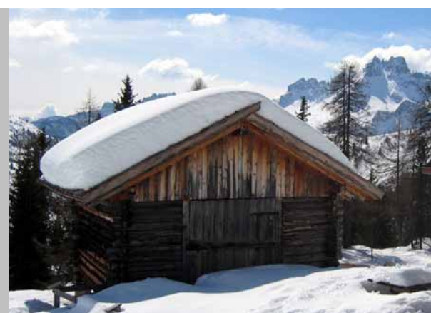
Kiirtan sotto la neve